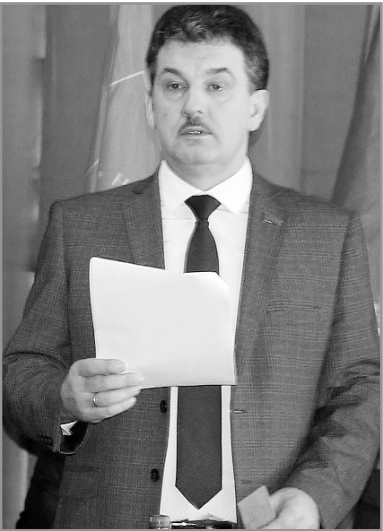
Дорогие товарищи! Уважаемые делегаты 45-й отчетно-выборной Конференции Брянского областного отделения КПРФ!

Наша Конференция проходит в условиях пандемии и введенных в связи с этим в регионе ограничений. По многим направлениям партийной деятельности мы приступили к работе в новых условиях. От живого общения с людьми (будь то протестные или партийные мероприятия, совместные Пленумы ЦК и ЦКРК) мы, вынужденно, хотя и временно, перешли к работе в режиме видеосвязи в реальном времени. Отдельные сотрудники областного отделения переведены на удаленный режим работы.