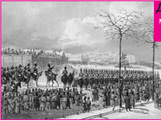
«Их дело не пропало!» В.И. Ленин

195 лет назад, 26 (14 по ст. стилю) декабря 1825 года в Петербурге, на Сенатской площади, началось вооружённое выступление русских дворянских революционеров. Это было одно из первых хорошо организованных восстаний в Российской Империи. Оно было направлено против укрепления власти самодержавия, а также против закрепощения простых людей. Революционеры пропагандировали важный политический тезис той эпохи – отмена крепостного права. Подавленное правительственными войсками, это восстание оказало большое влияние на революционное движение в стране.