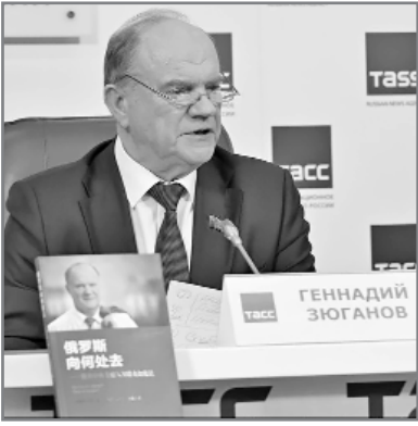
16 марта в пресс-центре ТАСС с участием Председателя ЦК КПРФ Г.А. Зюганова прошла пресс-конференция на тему: «Россия – Китай: общий путь в будущее».