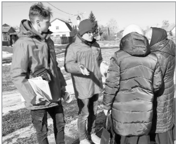
(Окончание. Начало на 1-й стр.).

Что особенно видно на примере Добрунского тепличного комбината, который сегодня, после его захвата семейством депутата-единоросса, переживает не лучшие времена. Это и есть суть нынешнего капитализма, когда прибыль приватизируется, а убытки национализируются.