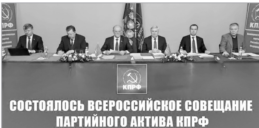
СОСТОЯЛОСЬ ВСЕРОССИЙСКОЕ СОВЕЩАНИЕ ПАРТИЙНОГО АКТИВА КПРФ