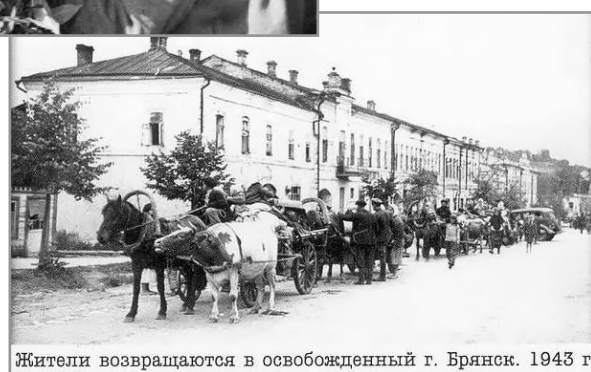
Жители возвращаются в освобожденный г. Брянск. 1943 г.

Город начинал новую жизнь, которая по напряженности борьбы за существование мало чем отличалась от фронтовой. Город лежал в развалинах. На месте «Арсенала» были груды кирпича и бетона, гигантские спруты металлической арматуры. А по улицам с узлами и котками, с тачками и