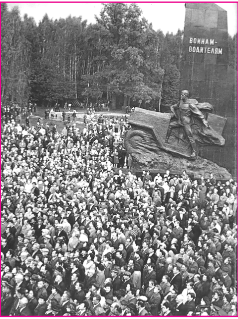
55 лет назад, 12 сентября 1968 года, у автомобильного шоссе Брянск-Орёл открыт первый в стране памятник воинам-водителям, участникам Великой Отечественной войны.

В 1968 году Брянская область праздновала 25-летие со дня освобождения от немецко-фашистских захватчиков. В честь подвига воинов-водителей на 112-м километре автодороги Орёл-Брянск-Витебск в живописном месте в урочище Осиновая горка был воздвигнут памятник. У подножия тридцатиметрового пилона – фигура солдата-водителя. Он стоит на подножке вздыбленного автомобиля. Правая рука воина лежит на руле, взгляд устремлен вперёд, на дорогу.